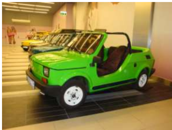
Malubats - kabriolet

To prawdopodobnie pierwsze na świecie Muzeum Fiata 126p , a w szczególności unikalnych, czasami jedynych egzemplarzy. Pick-up – pojazd inny niż Bombel, Malubats - kabriolet wykonany z laminatów, na zamówienie Holandii dla ratownictwa plażowego, pojazd MO i WSW, BIS, JI-126, przyczepa kempingowa namiotowa składana GK 110, przyczepa kempingowa N-126p A,