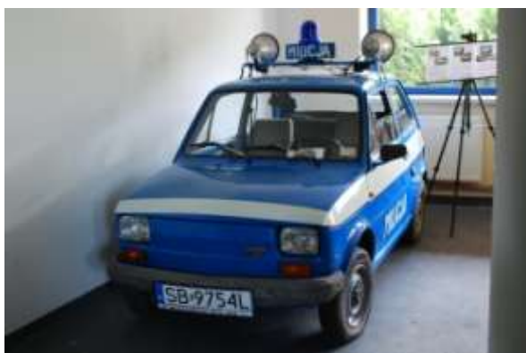
PF 126p Milicji