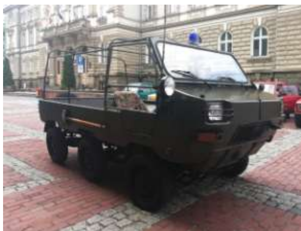
LPT w wersji desantowej

Placówka posiadająca kilkanaście unikatowych egzemplarzy prototypowych pojazdów marki Polski Fiat 126p , którą otwarto 8 czerwca 2013 roku. Prowadzi to muzeum pasjonat Malucha pan Antoni Przychodzień. Posiada w swych zbiorach zdobyte na końcu Polski niezwykle egzemplarze pojazdów, przyczep kempingowych i towarowych oraz motopomp.