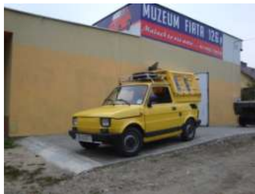
PF 126p pick-up

Jest zapraszany ze swoją kolekcją na takie imprezy, jak 9-ta edycja „Vera Street Racing” zorganizowana w Krakowie (8 września 2018). Na wszelakich rajdach prezentuje naszą myśl techniczną, pokazując egzemplarze, których nikt nigdy nie widział. Jak pojazd WSW z karabinem mocowanym w tylnej części samochodu. Pojazd MO, który był pojazdem propagandowym Milicji Obywatelskiej, LPT – pojazd desantowy - jedyny tego typu w Pol-